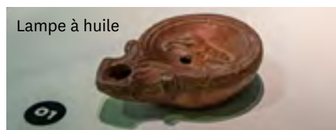
Lampe à huile