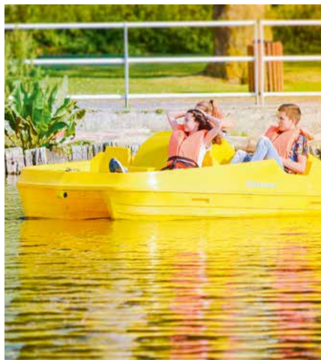
Loisiparc, une base de loisirs incontournable qui a attiré cette année 70 000 personnes.

La gestion de nos finances est saine : nous maîtrisons notre budget de fonctionnement, nous diminuons le poids de la dette de 9 millions d'euros par an, et grâce aussi aux recettes générées par le développement économique, nous pouvons investir dans des projets qui vont être utiles pour chaque habitant du territoire, avec le soutien de nos partenaires : le Département, la Région, l'Etat et l'Europe. Il nous faut se projeter vers 2019, mais aussi vers 2020 et 2021. Ce qui a été annoncé — la patinoire, le boulodrome et le planétarium — se fera. Les élus communautaires œuvrent au quotidien pour améliorer la qualité de vie des habitants. Vous allez d'ailleurs en entendre parler au printemps : nous allons actualiser notre programme d'actions en faveur de la préservation de la nature et de l'amélioration du cadre de vie.