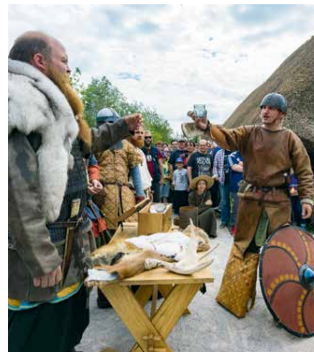
Le parc archéologique Arkéos est le lieu idéal pour accueillir des fêtes médiévales.