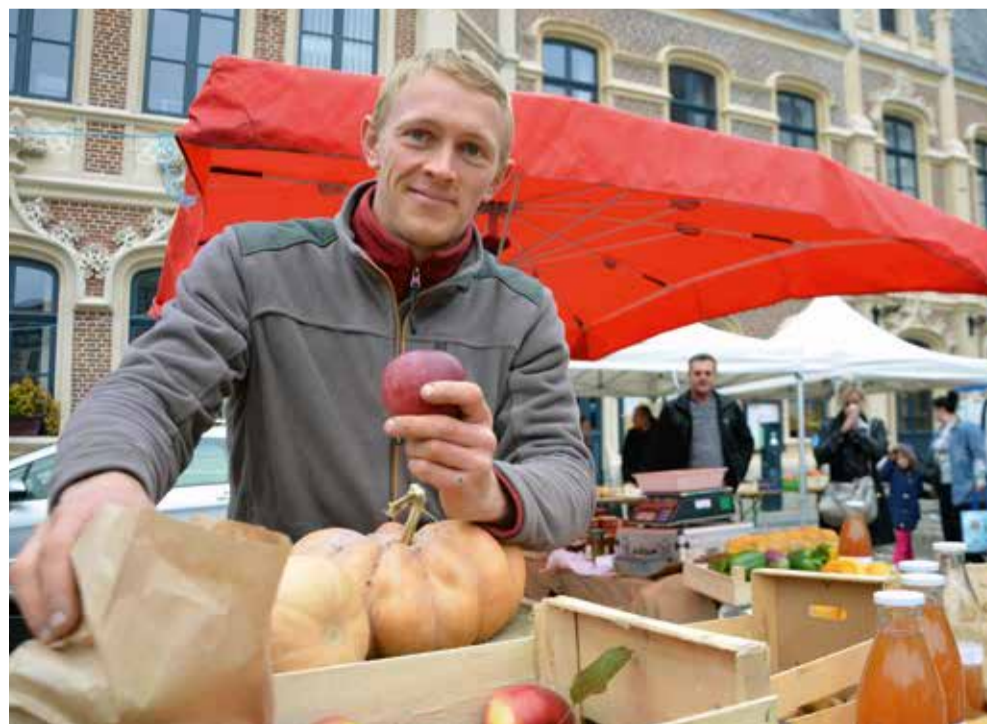
Le savoir-faire des producteurs locaux a une nouvelle fois été mis en avant le 7 octobre dernier. Le marché des producteurs locaux organisé par la CAD à Douai a attiré plus de 7 000 personnes.