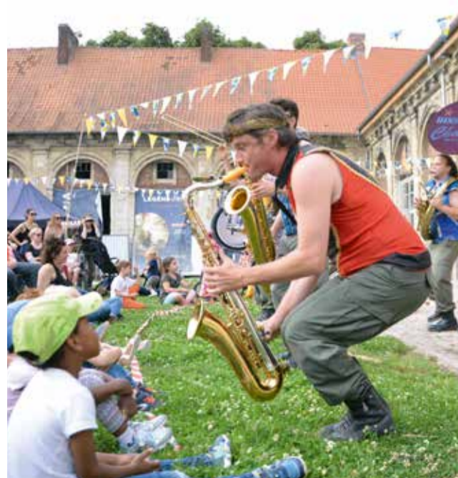
Legendoria, le Royaume des contes et légendes, propose une grande diversité de spectacles.