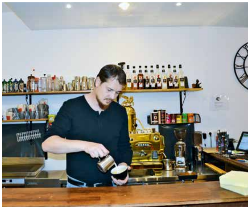
L'aide de la CAD a bénéficié à Destination Café, qui développe aujourd'hui son activité au 92, rue de la Mairie à Douai.