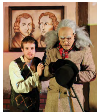
Des spectacles familiaux seront proposés tout au long de l'année à Légendoria. Ils ont tous fait salle comble lors du week-end inaugural.

L'arrivée du printemps sera fêtée comme il se doit par des compagnies locales lors de spectacles mêlant théâtre, chant et cirque. En mai, les peuples imaginaires (elfes, lutins et ogres) gambaderont dans la ferme du château de Bernicourt. Ils laisseront place, en juin, aux contes qui ont rythmé notre enfance : Le Petit Chaperon Rouge , Pierre et le loup ... Une programmation qui devrait pleinement satisfaire tous les publics.