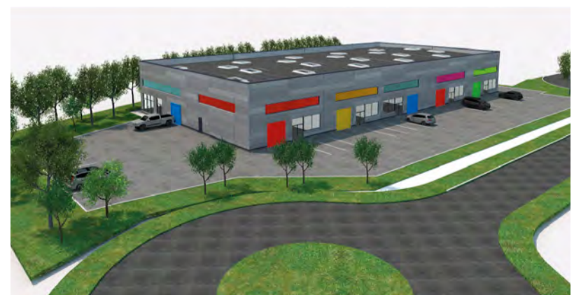
Les cellules mises à la location par First Realty conviendront particulièrement bien aux entreprises artisanales ou innovantes.

Cette nouvelle structure mettra en location neuf cellules non aménagées de 176 à 265 m 2 , avec une grande hauteur disponible. Elle sera conçue de telle sorte qu'elle sera facilement divisible en fonction de la demande. Les locaux abriteront des sociétés