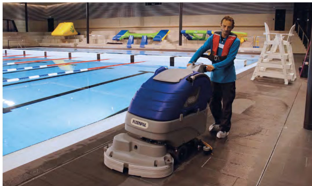
Les travailleurs des Papillons Blancs du Douaisis nettoient les pourtours des bassins de Sourcéane avec des auto-laveuses désinfectant le sol à l'ozone.

Deux autres structures des Papillons blancs du Douaisis contribuent à la réussite de Sourcéane. Au cœur de l'écoquartier du Raquet, l'APEI se développe sur un terrain de trois hectares. Alors que le siège social sera inauguré le 28 février, la cuisine adaptée (2 200 repas par jour !) et la blanchisserie de l'Établissement et service d'aide par le travail (ESAT) y sont déjà opérationnelles. Chaque jour, de 6 h à 20 h, la blanchisserie prend notamment en charge la centaine de peignoirs portés par les usagers de l'espace bien-être de Sourcéane, ainsi que les draps de bain, serviettes