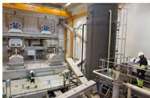
Les déchets ménagers de la CAD sont valorisés dans une usine unique en France.

L' ancienne usine d'incinération du territoire ne permettait pas la valorisation des déchets ménagers. Elle a été démantelée en 2014 et remplacée in situ par une unité ultra-moderne de Tri Valorisation Matière et Energie (TVME). Le SYMEVAD* a fait le choix de technologies uniques en France. Proposées par l'entreprise Tiru, une filiale d'EDF, elles optimisent, depuis janvier 2016, le recyclage de la matière et l'exploitation du potentiel énergétique contenu dans les déchets. Derrière les grandes cuves, la sphère et les tours blanches de cette unité, implantées le long de l'A1 sur la plateforme multimodale Delta 3, se cache un concentré de technologies innovantes. Tiru a réussi le pari de transformer les déchets en biogaz (énergie renouvelable à 100%), injecté sur le réseau de GrDF, et de produire des combustibles solides de récupération à haut pouvoir calorifique, utilisés en particulier par les cimentiers et les papetiers. L'inauguration du site, le 9 décembre, a été l'occasion de présenter les excellents résultats de ces premiers mois d'exploitation.