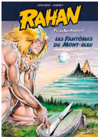
Rahan prendra possession d'Arkéos le 18 mars.

Rahan, le célèbre personnage de bande dessinée, héros de la Préhistoire, s'empare d'Arkéos, le musée - parc archéologique du Douaisis, du 18 mars au 17 septembre ! Cette exposition, jamais encore présentée au nord de la Seine, propose de croiser le regard scientifique de l'archéologue et celui de l'amateur de BD. Elle est constituée de planches issues de la bande dessinée originale, d'objets reconstitués, d'armes, de poteries, d'une pirogue... Jeux, livrets et BD pour les plus jeunes. Gratuit.