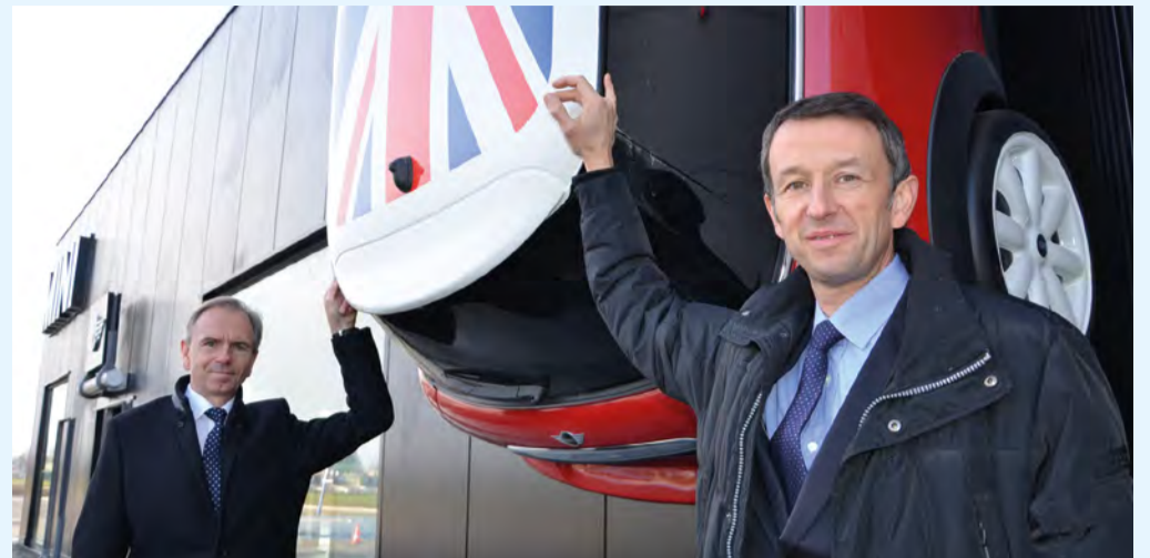
Le groupe Lempereur renforce l'attractivité du parc d'activités du Luc en y ouvrant de nouvelles concessions automobiles, dont la marque britannique Mini.

Nous sommes très contents d'arriver dans le Douaisis car nous y sommes très attendus. Nous souhaitons couvrir le Douaisis et le Cambrésis avec les marques que je représente. J'ai repris plusieurs concessions et on a pour principe de créer du plaisir autour de l'automobile. Cela passe par